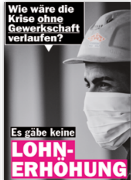
Unsere Kampagne gibt es auch auf Facebook

Neue Werbematerialien zu deiner Unterstützung gibt es als Download oder gedruckt in deiner Landesorganisation