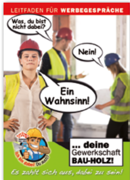
Damit du noch erfolgreicher werben kannst